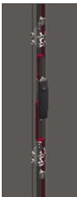
Запорные штанги блокируются дверными петлями