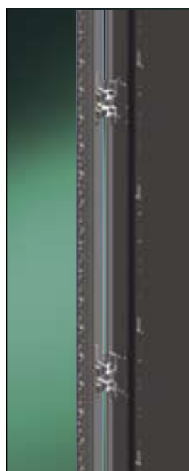
Петли в качестве держателей передних дверей

Боковые панели крепятся непосредственно к петлям