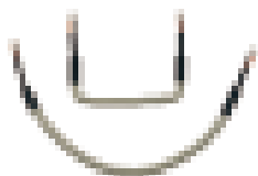
SK 0002 B99