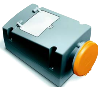
Розетка с автоматом