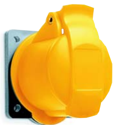
Розетка для скрытой проводки прямой фланец, мин.