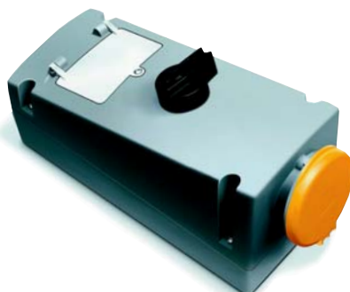
Розетка с выключателем, блокировкой и автоматом