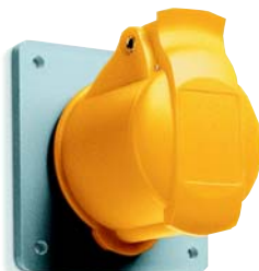
Розетка для скрытой проводки прямой фланец