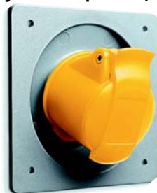
Розетка для скрытой проводки угловой фланец