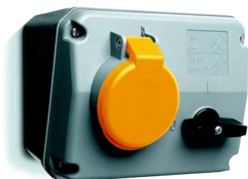
Розетка с выключателем и блокировкой