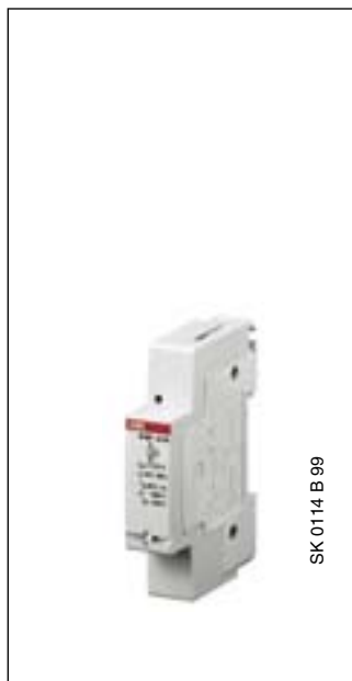
SK 0114 B 99